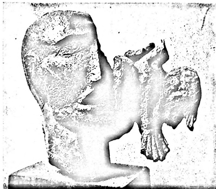
(escultura de Zadkine)

Por muy pacífico, ordenado y tranquilizador que sea este proceso de cambio del Estado autoritario al Estado democrático, a nadie se le oculta, en la derecha o en la izquierda, que este cambio, pese a que no altere las estructuras económicas, supone una auténtica revolución política. No se trata de una cuestión de palabras: evolución o revolución. Ni de distintos caminos para llegar